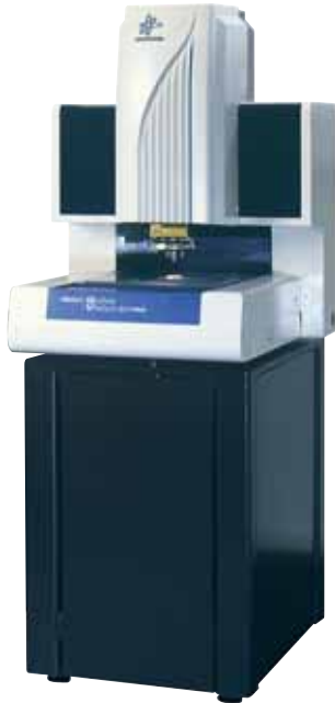
QUICK VISION ELF